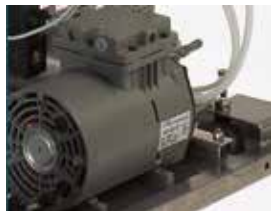
FVG & FVS - Air compressor FVG & FVS - Compressore aria