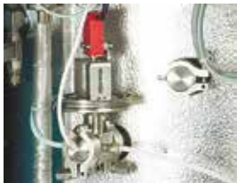
FVG - Membrane safety device for preventing lid opening even in case of minimal over pressure FVG - Dispositivo di sicurezza a membrana per evitare l'apertura del coperchio anche in case di minima sovrappressione