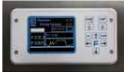
FVG & FVS - TSC 09 Microprocessor FVG & FVS - Microprocessore TSC 09