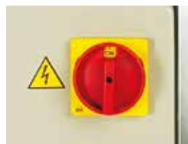
FVG - Main switch for emergency stop FVG - Interruttore principale per emergenza