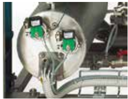
FVG & FVS - Steam generator FVG & FVS - Generatore di vapore