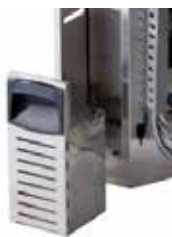
FVS - Front mounted condensate tank FVS - Tanica frontale per recupero condensa