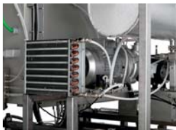
Condensate drain cooler and vacuum pump / Kondensatablaufkühler und Vakuumpumpe