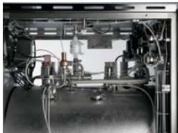
Modulating valve on steam inlet Modulares Ventil am Dampfinslass